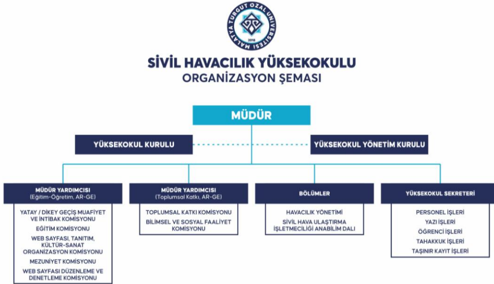
Şekil 1: Sivil Havacılık Yüksekokulu Teşkilat Şeması